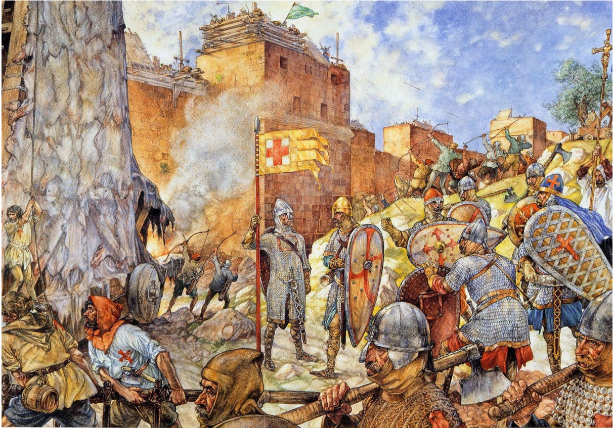
Het beleg en de val van de stad Acco tijdens de kruistochten (1291). Graaf Ewout staat geheel rechts afgebeeld: de ridder met de blauwe mantel en helm. Hij heeft duidelijk de leiding tijdens het beleg!