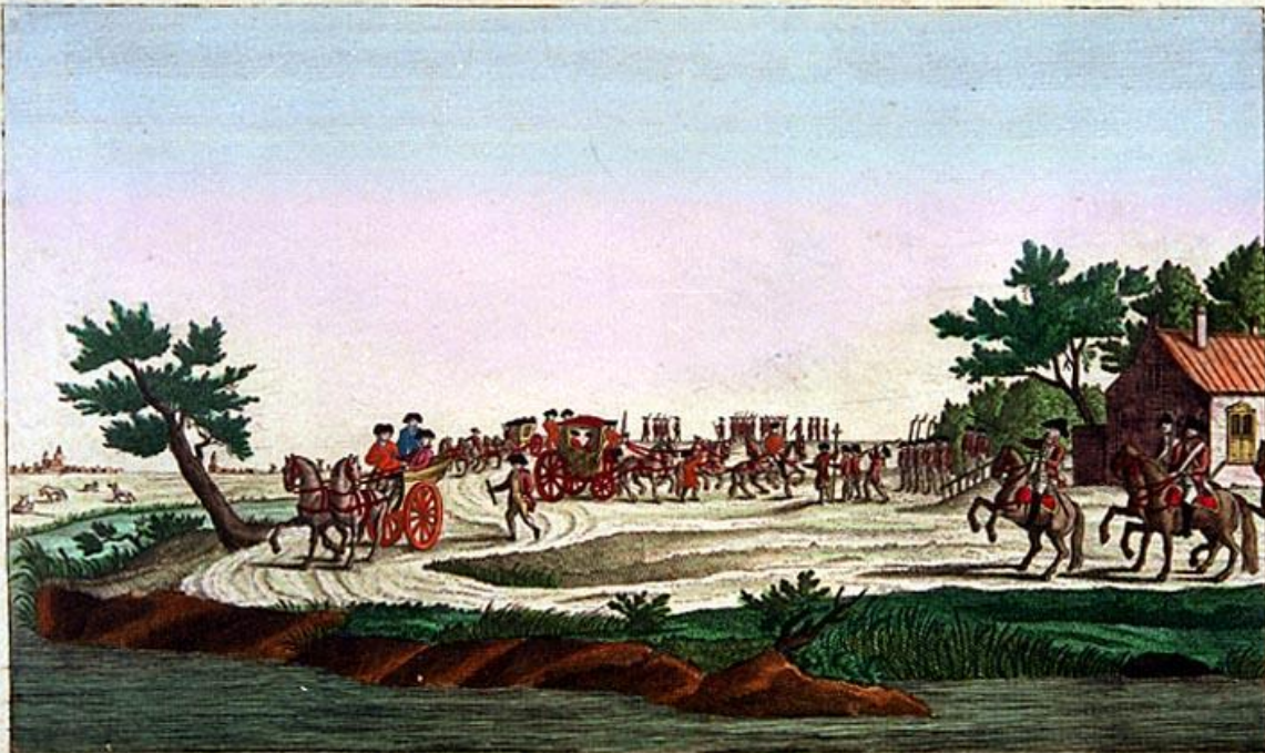
Het Geweldig aanranden en tegenhouden van HAARE KONINGLYK HOOGHIED op de weg bij Kwaartsrecht Door een hoop Vrij- Corporisten. den 28. Junij 1787.